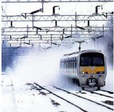
protection pour chemins de fer