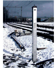
meteoscan station météo

Réalisez un horaire d'hiver fiable avec les systèmes de chauffage d'aiguillages de Pintsch Aben .