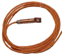
sondes de température pour le rail