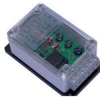
controle relais voor temperatuur